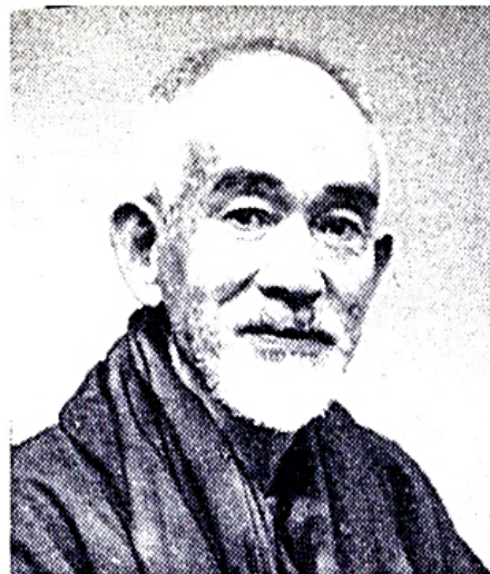
志賀直哉(しが なおや、1883年(明治16年)2月20日 - 1971年(昭和46年)10月21日)は、日本の小説家。